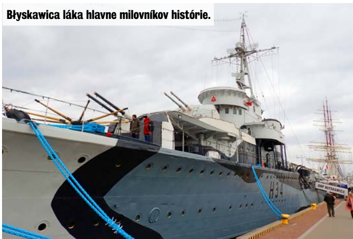
Błyskawica láka hlavne milovníkov histórie.