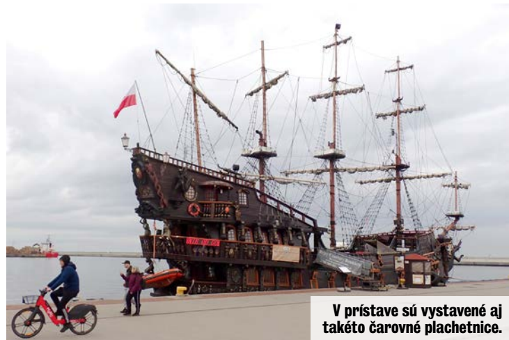
V prístave sú vystavené aj takéto čarovné plachetnice.

„Vyrastala som v Poprade v činžiaku na siedmom poschodí. Nečudo, že mám vzťah k horám →