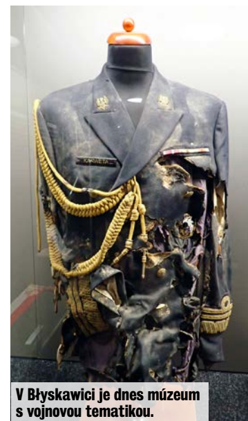
V Błyskawici je dnes múzeum s vojnovou tematikou.