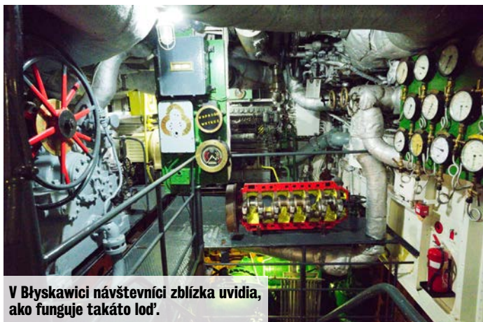
V Błyskawici návštevníci zblízkavidia, ako funguje takáto loď.

rec – veterán z druhej svetovej vojny a jediná spojenecká bojová loď, ktorá sa aktívne zúčastňovala na operáciách počas celej vojny od 1. septembra 1939 do 8. mája 1945.