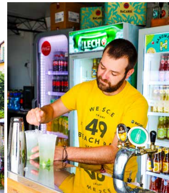
▲ BY OG STRAND. Som reisemål er Polen mest kjent for sine storbyer, men landet med kyst mot Østersjøen er så mye mer enn urbane gleder. Kombinasjonen av stilige Sopot og strandperlen Hel er i alle fall god som gull.