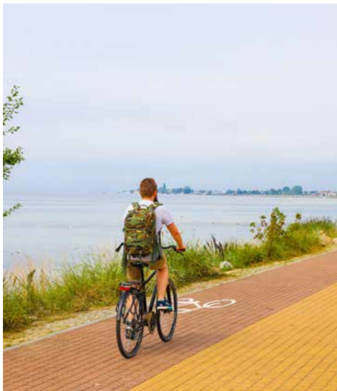
▲ TREND OG TRADISJON. Ærverdige Sopot har vært et kjent reisemål i over 100 år. Her er det stilige hotell og førsteklasses spa som lokker. Halvya Hel er mer ukjent, men bare en kort ferjetur fra «fastlandet». Flere mil med behagelige stier betyr gode forhold for sykkelturen.