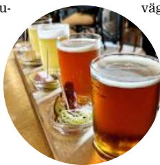
Testa ölprovning på PG 4, som tillverkar stans äldsta öl – Jopen. Receptet är från 1449.

stråk och uteserveringarna ligger på rad, likaså på den intilliggande ön Wyspa Spichrzów, vars smala nybyggda hus har modernistiska glasfasader. Korska ytterligare en bro och följ floden åt vänster längs Szafarnia-gatan. Här ligger många finkrogar som Geneza och Brovarnia. Flera restauranger har mikrobryggerier, yttersta toppkvalitet har restaurang PG 4 i Craft Beer Hotel uppe vid järnvägsstationen.