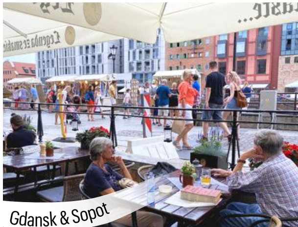
Gdansk & Sopot