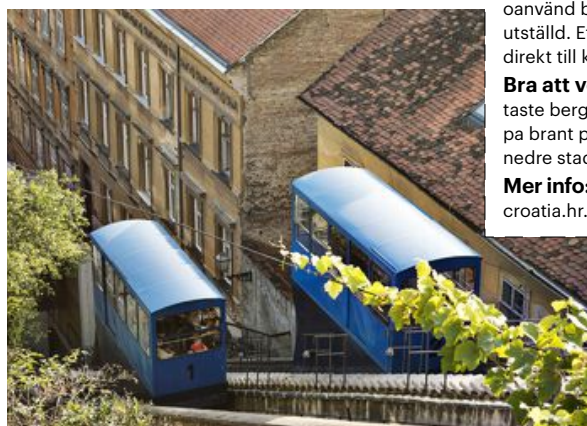
Den korta bergbanan går mellan Gornji grad och Donji grad, övre och nedre staden.