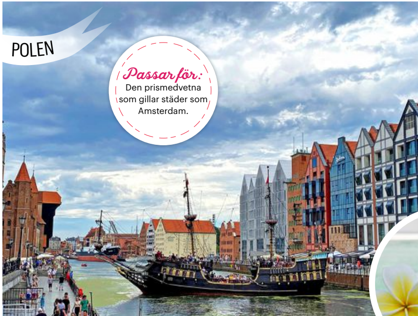
Flanera längs floden Motława – eller sätt dig på en av uteserveringarna.

Den prismedvetna som gillar städer som Amsterdam.