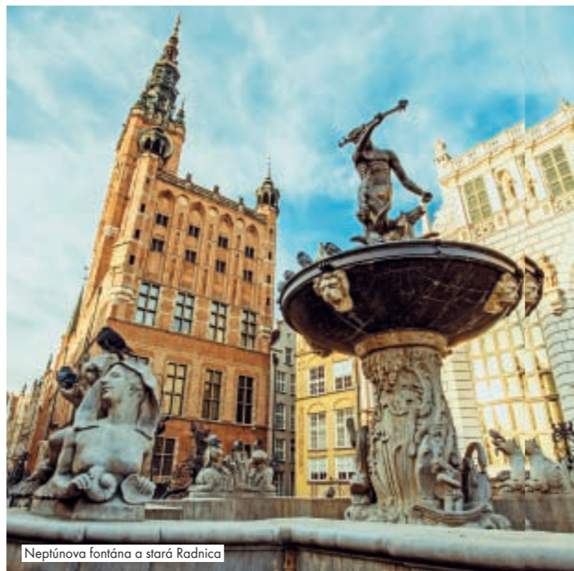
Neptúnova fontána a stará Radnica