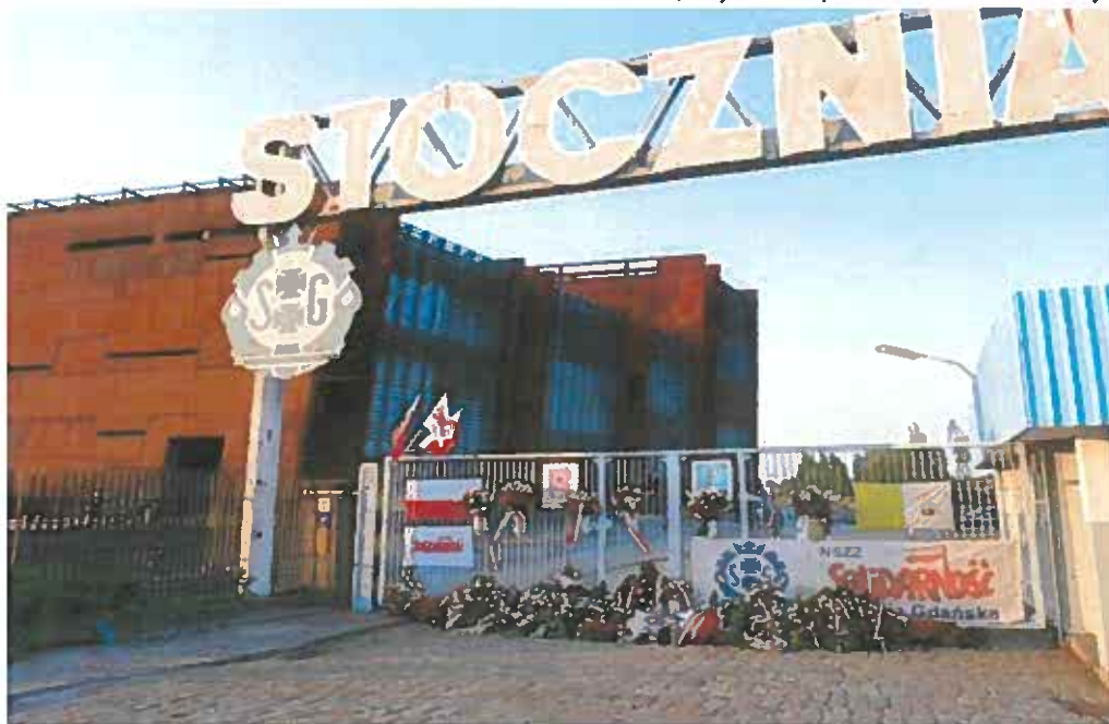
Figure symbolique de la Pologne, Lech Walesa, ouvrier électricien, fondateur du mouvement Solidarnosc, dont le rôle d'opposant au régime communiste est aujourd'hui parfois contesté. Rappelons qu'il a reçu le prix Nobel de la Paix en 1983. Le million de dollars qu'il reçut alors lui permit de déménager dans le quartier plus résidentiel d'Oliva mais aussi d'offrir une partie de ses gains aux chantiers navals.