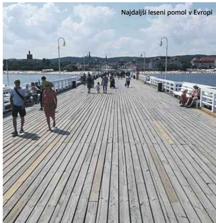
Najdaljši leseni pomol v Evropi

Na to opozarja težka mehanizacija ob robovih rek in morja, kot tudi žerjav iz 14. stoletja v starem delu mesta (ob reki Motława), ki je med drugim imel še funkcijo mestnih vrat. Nekoč največji žerjav na svetu je imel za tiste čase mistično moč, saj je bilo mogoče dvigniti do štiri tone težak tovar enajst metrov visoko. Kot večino drugih objektov je tudi žerjav leta 1945 doletela žalo-