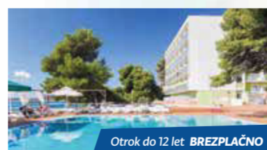
Otok do 12 let BREZPLAČNO

Depandansa Arausa 3* 8.8. – 24.8.2019 7 x polpenzion od 490 €/os.