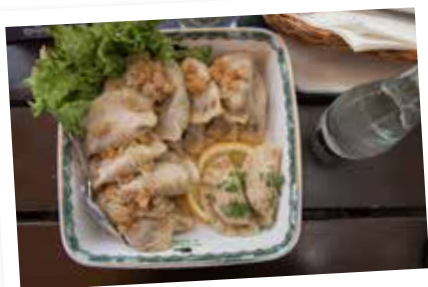
Poliska piroger är en traditionell rätt värd att prova vid ett besök i landet.

Det går också att rensa paletten med en snaps innehållandes Goldwasser. Det är alkohol som är smaksatt med ett tjugotal örter där det flyter runt 23-karats guldflingor. Sägna säger att statyn av Neptun som är mitt i stadens centrum och invånarnas mötesplats har en magisk förmåga. Vart hundra år så förvandlar han vattnet i fontänen till just Goldwasser. Problemet är bara att ingen vet när detta kommer att ske. En tanke är att det kanske är detta som gör att det just är fontänen som är mötesplatsen – ingen vill missa när Neptun förvandlar vattnet till Goldwasser.