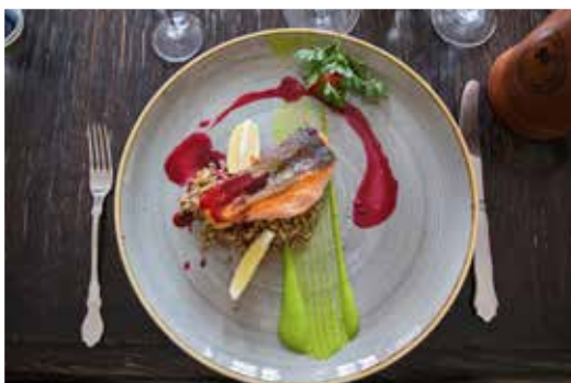
På restaurang Gdanski Bowke serveras lax med solrosrisotto.