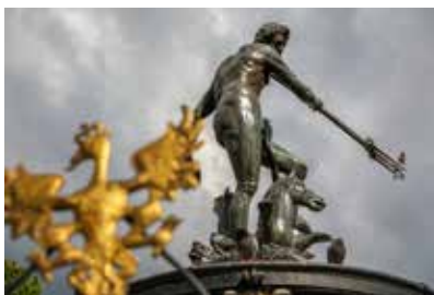
Vart hundra år sägs det att vatt- net i fontänen blir till Goldwasser.