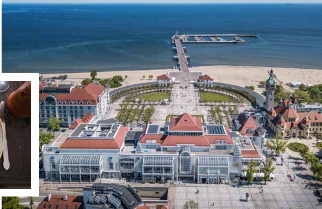
Sopotpiren med hotell Sheraton är en riktig turistmagnet.

erbjuder en unik paté till förrätt som lämnar smaklökarna glada. Det finns också ett flertal så kallade "Pierogarnie" där traditionella polska piroger serveras. Dessa är lite utav landets nationalrätt och det är nästan obligatoriskt att smaka dessa under resan till Polen.