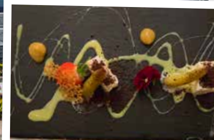
Restaurang Bulaj serverar troligtvis Sopot's bästa maträtter.