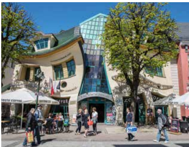
Krzywy Domen är en uppseendeväckande byggnad som inte kan kallas annat än unik.

smaker, serveras traditionell polsk husmanskost men med en modern tvist. Ett exempel är de polska pirogerna som istället för att vara fyllda med ost, kött eller svamp, är fyllda med fisk – en spännande och fräsch meny med andra ord. Och på tal om Monte Carlo så heter huvudstråket i Sopot Monte Cassino. Det är gatan som erbjuder allt från shopping till restauranger och barer även om majoriteten av ställena på denna gata är just restauranger.