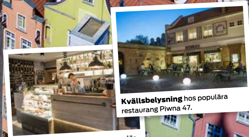
Restaurang Piwna 47 är en populär restaurang i Gdańsk.