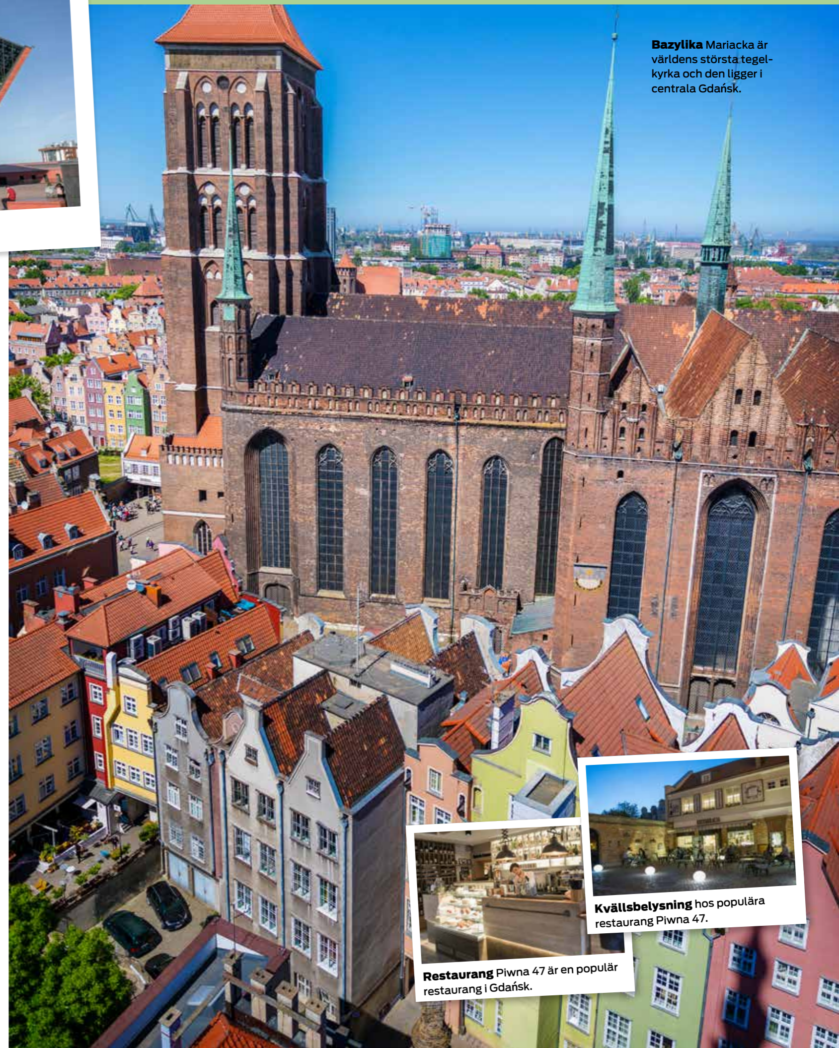
Bazylika Mariacka är världens största tegelkyrka och den ligger i centrala Gdańsk.