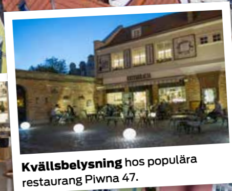
Kvällsbelysning hos populära restaurang Piwna 47.