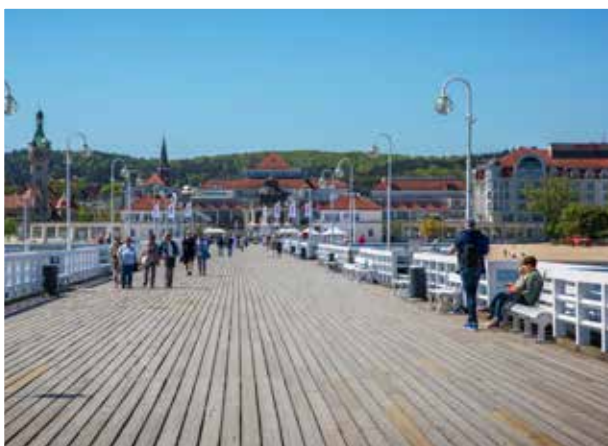
Med sina 516 meter sägs det att Sopot Molo är Europas längsta träpir.