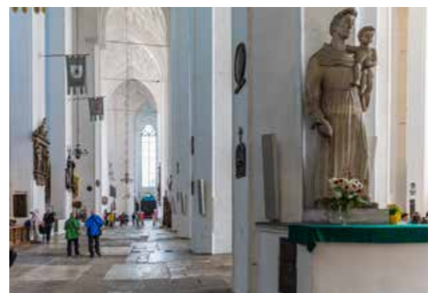
Det får plats 25 000 personer inne i världens största tegelkyrka.