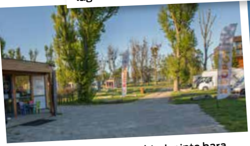
Sopot 34 Camp & Sail erbjuder inte bara campingplatser utan även seglarskola.