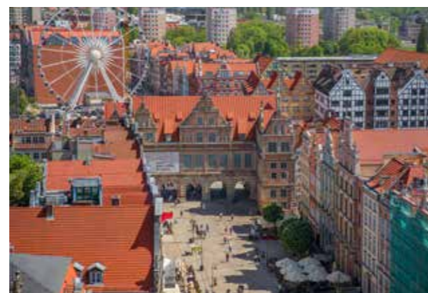
En väldigt vacker stad som har mycket att erbjuda.