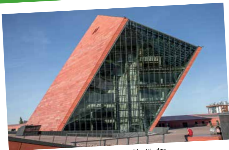
Muzeum II Wojny Swiatowej visar hur olika länder påverkades av andra världskriget.

RESTAURANGER SOM erbjuder mat "utöver det vanliga" finns det gott om i Gdańsk. Gdański Bowke stoltserar med lax och solrosrisotto medan restaurangen Szafarnia 10