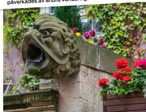
Så kallade gargoyles (vattenkastare) finns det gott om på Ulica Mariacka i Gdańsk.