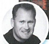
MIKAELS BÄSTA TIPS