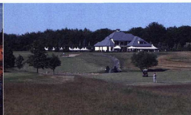
Sierra Golf clubhuis.