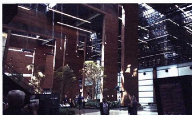
Gdansk de scheepswerf van Solidarnosz is nu een museum.

Golfers zullen niet meteen denken aan een golftrip naar Polen. Toch is het een aanrader. Troeven? Uitstekende nieuwe hotels, lekker eten en perfect onderhouden golfbanen. En bovendien is alles tegen meer dan redelijke prijzen. Als de golfer ook nog een beetje geïnteresseerd is in toerisme, dan is de Poolse havenstad een boeiende bestemming voor een korte trip.