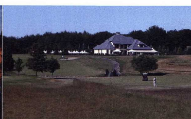
Le club-house du Sierra Golf.