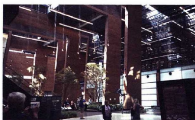
A Gdansk, le chantier naval de Solidarnosc est aujourd'hui un musée.

La Pologne n'est probablement pas la destination de prédilection des golfeurs. Pourtant, elle a tout ce dont ils peuvent rêver: des hôtels flambant neufs, une délicieuse gastronomie et des parcours de golf très bien entretenus. Le tout à un prix plus qu'attractif. Si les golfeurs en question se sentent également l'âme de touristes, cette ville portuaire se prête alors parfaitement à un petit séjour.