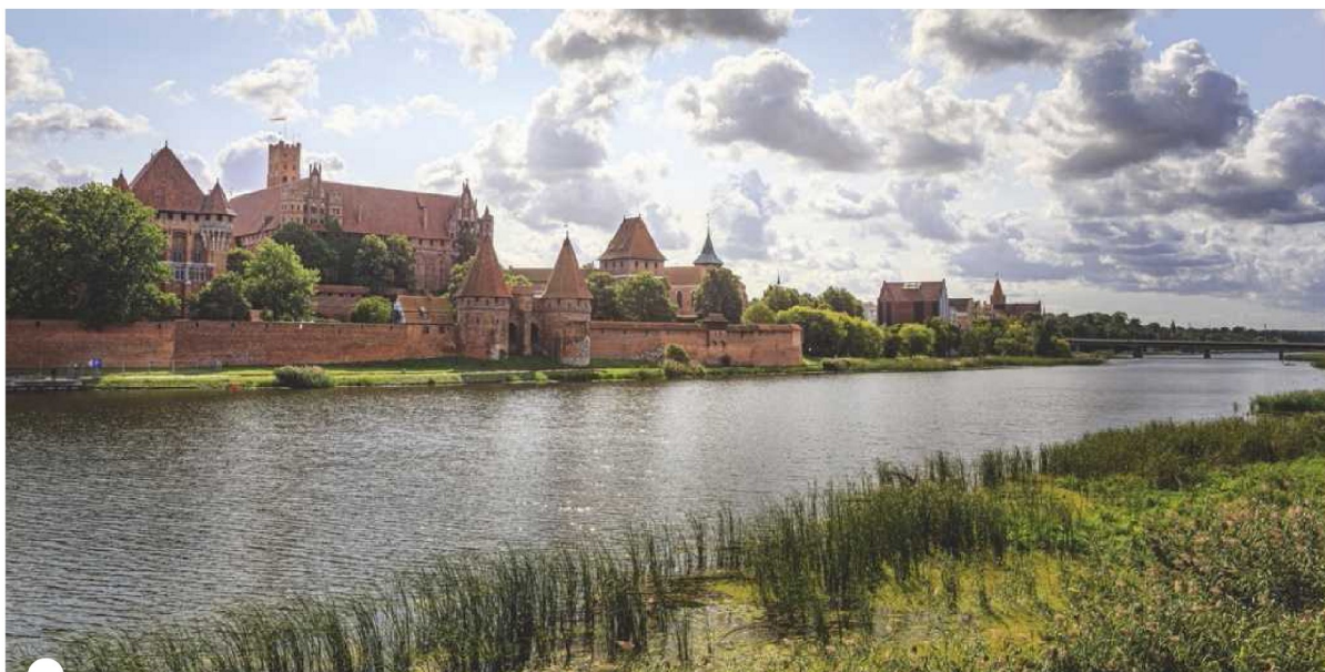
Slot Marienburg, het grootste kasteel ter wereld

Op een uurtje met de auto staat het grootste middeleeuwse kasteel ter wereld. Slot Marienburg (of Malbork in het Pools) werd door de Teutoonse orde gebouwd en moest een en al macht en gezag uitstralen. Het complex van 4,5 miljoen bakstenen staat haast vanzelfsprekend op de Unesco-werelderfgoedlijst.