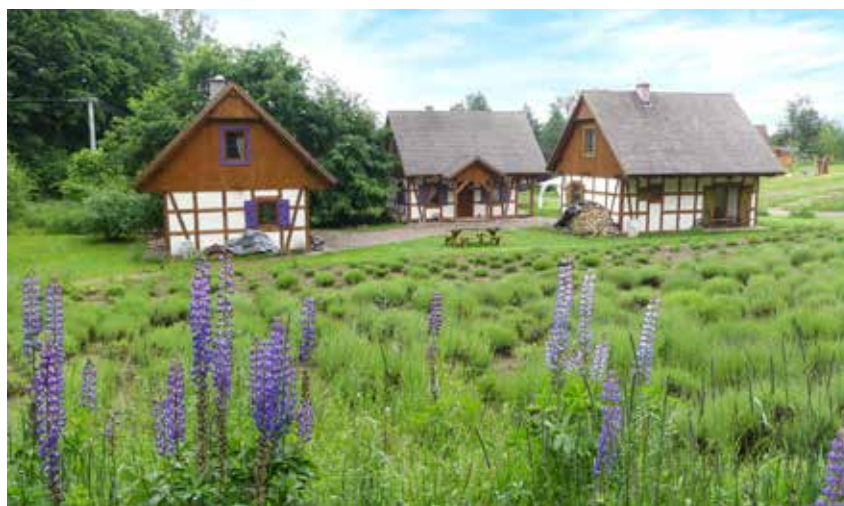
Idyllisch plaatje uit het land van de Kasjoeben.

In het middeleeuwse Frankrijk bloeide de machtige Tempeliersorde. Het toenmalige Pruisen had zijn vergelijkbare 'Orde van de Teutoonse Ridders van het Hospitaal van de Heilige Maagd Maria in Jeruzalem' – een hele mond vol –, ontstaan rond 1191. Zoals hun Franse collega's stond ook deze religieus-militaire gemeenschap in voor de bescherming van christelijke pelgrims naar het Heilige Land. Begin 14de eeuw vestigden de Teutonen zich in Marienburg, het huidige Malbork en richtten er een monumentale bakstenen burcht op. Stilaan evolueerde de orde tot een machtige staat binnen de staat, wat onvermijdelijk tot hommele moest leiden. De Teutonen kregen het inderdaad aan de stok met de Poolse adel, voerden oorlog en verloren enkele matches, waardoor hun macht afbrokkelde. De burcht in Malbork overleefde echter zowel de belegeringen als de tijd, tot ze in 1945 zwaar beschadigd uit de oorlog kwam. Het vergde jaren om het sprookjeskasteel in zijn oude glorie te herstellen. Het schitterende complex werd ondertussen opgenomen op de Unesco-werelderfgoedlijst. Een bezoek doorheen de indrukwekkende vertrekken leidt je binnen in de fascinerende wereld van de middeleeuwse orde.