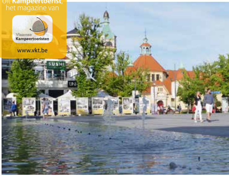
Sopot, een mondain kuststadje.