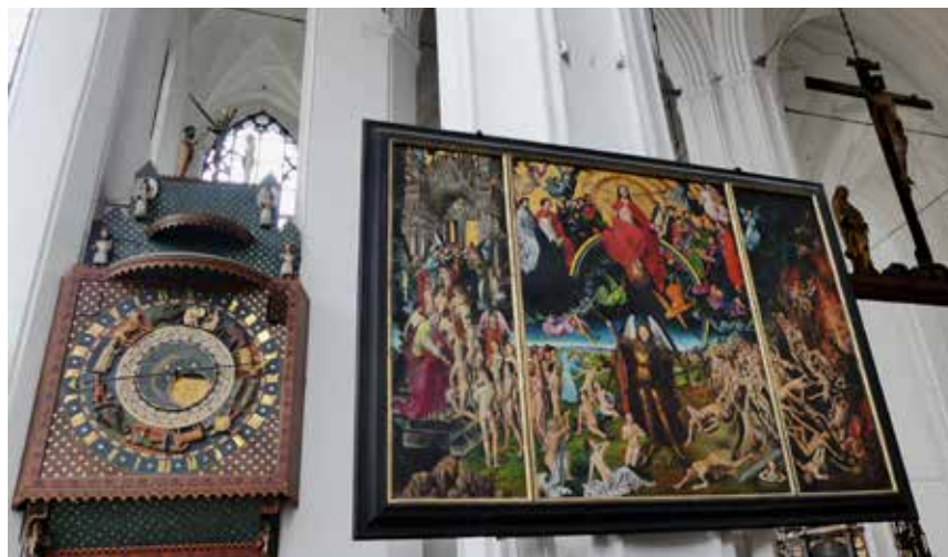
Replica van het Laatste Oordeel van Hans Memling geëscorteerd door de astronomische klok uit 1470 in de Mariakerk.

Gdansk is van een ander kaliber dan haar twee zusjes. De eerbiedwaardige duizendjarige heeft een bewogen geschiedenis achter de rug, met de Tweede Wereldoorlog als triest orgelpunt. Tijdens het terugtrekken van zijn troepen vernietigt Duitsland grote delen van wat op dat moment nog Danzig heet. De binnenvallende Russen maken het sloopwerk vakkundig verder af. Vastberaden om haar ziel te behouden, speelt de trotse, karaktervolle stad het klaar om alle verwoeste wijken steen voor steen terug op te bouwen. Het duurt wel 20 jaar vooraleer uit een vlakte vol puin weer een schitterende stad tevoorschijn komt. De machtige Hanzestad uit de 16de en 17de eeuw verrijst letterlijk uit haar as en herbeleeft vier eeuwen later haar glorieuze verleden. Niemand die merkt dat de kleurrijke huizen niet ouder zijn dan een halve eeuw. Opvallend ook hoe de architectuur sterke verwantschap vertoont met Hollandse en sommige Vlaamse steden. Vrolijk, joviaal en vrijgevochten zijn erg toepasselijke adjectieven voor deze havenstad met open blik op de zee. Dat net hier Solidarnosc ontstond en met succes het hoofd bood aan het arbeidersparadijs van het toenmalige communistische regime, is geen toeval. Zoals het water van de Wisla-rivier zich in de baai van Gdansk verenigt met het zeewater, zo vermengen bezoekers uit verschillende landen zich in Gdansk en creëren er een constante vakantiesfeer.