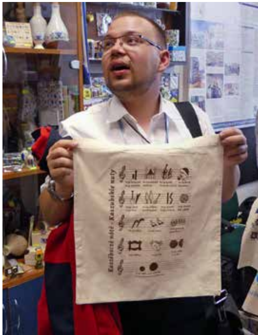
Al zingend trachten we het Kasjoebische alfabet te leren.