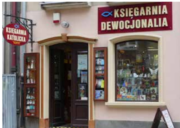
Religieuze boekenwinkel in Gdańsk.