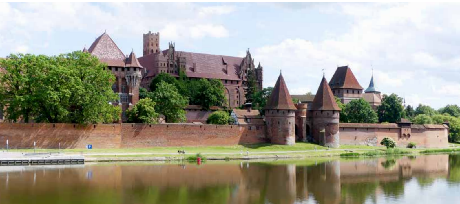
De burcht van de Teutoonse ridders in Malbork presenteert zich als een echt sprookjeskasteel.