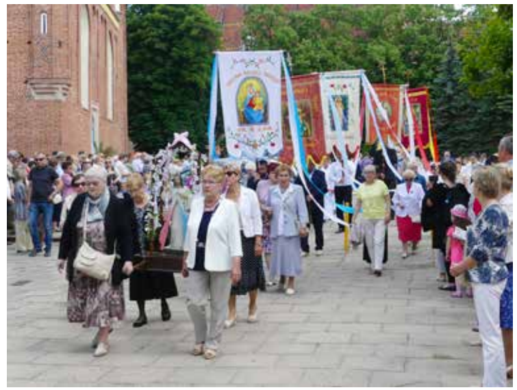
Polen, door en door katholiek. Processie in Malbork.