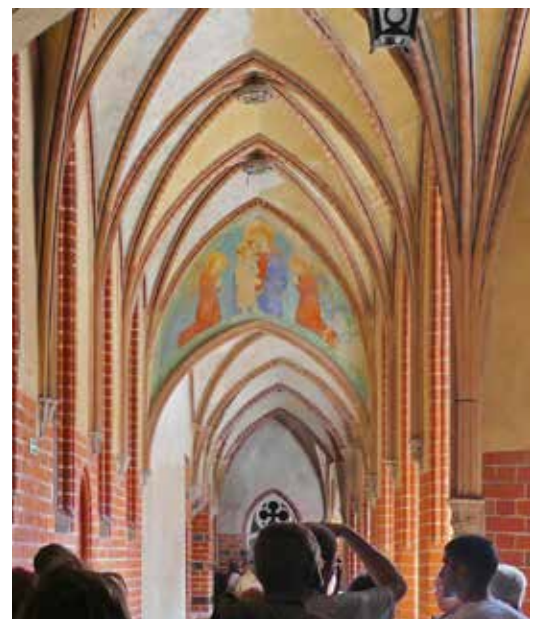
Het optrekje van de Teutoonse ridders in Malbork twijfelt tussen burcht en klooster.