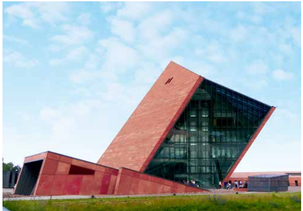
Dit splinternieuwe museumgebouw over de Tweede Wereldoorlog in Gdansk valt wel op ...