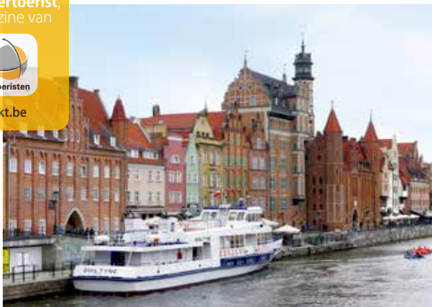
Aan de Długie Pobrzeże, de Lange Kade van de Motława-rivier in Gdańsk, meerden eertijds alle grote zeil- en handelsschepen aan.