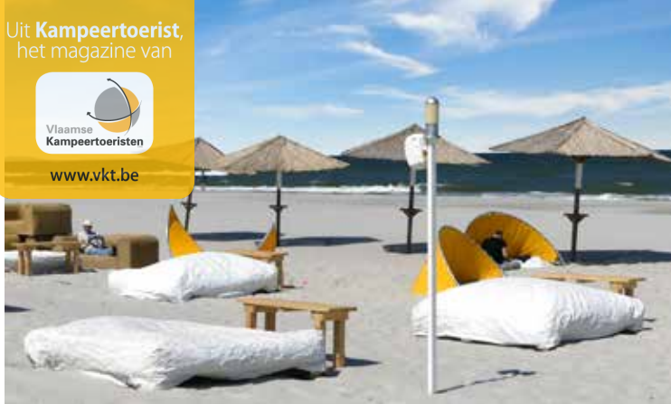
Hel heeft ook stranden met mondaine allures.