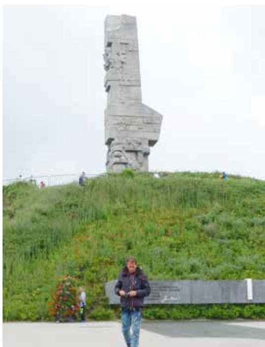
Op de Westerplatte werd het eerste schot van de Tweede Wereldoorlog gelost.

In de westelijke achtertuin van Gdansk ontvouwt zich een heuvelland van glooiende akkers en bossen. Dit is Kasjoebenland. Het hooi ligt te drogen en klaprozen schilderen een klad hevig rood in het wiegende koren. Heel af en toe verschijnt ergens een verloren gehucht onder hoge boomkruinen. Kleurrijk versierde veldkapelletjes verwelkomen je bij het binnenrijden van de dorpjes: landelijk Polen op zijn best. De Kasjoeben, een van oorsprong Slavisch volk, wisten doorheen alle troebele tijden hun authenticiteit te bewaren. Door en door trouw aan de Kerk, aan hun tradities en taal vormen ze een aparte entiteit binnen Pommeren. Typisch voor de Kasjoeben is het gebruik van snuiftabak, een gewoonte die ze graag met je delen. Bij onbevoegden resulteert deze snuiverij steevast in hevige niesbuien en waterende ogen. Wie deze streek met Zwitserland vergelijkt (men spreekt hier zelfs van Klein Zwitserland), loopt iets te hard van stapel. Maar mooi en rustig is het er absoluut. Wandelen, fietsen, paardrijden, kanovaren en vissen zijn hier aan de orde. Zoek je rust