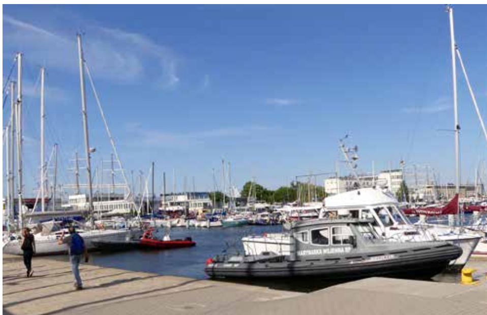
Naast een grote handelshaven bezit Gdynia ook een mooie jachthaven.