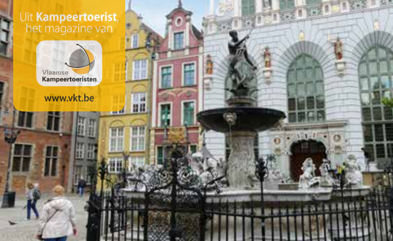
Een standbeeld van Neptunus siert de Lange Markt van Gdansk.