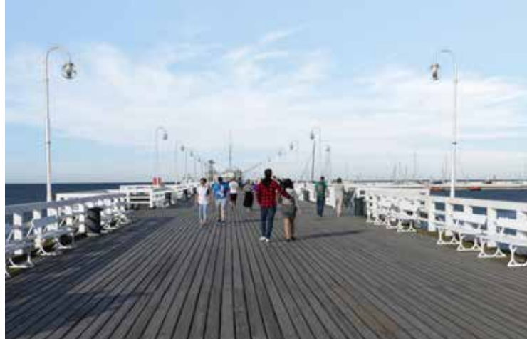
De langste houten pier van Europa, het visitekaartje van Sopot.