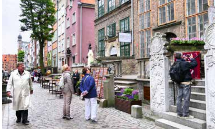
De Ulica Mariacka, keurig heropgebouwd na de Tweede Wereldoorlog.