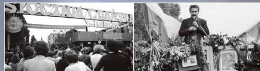
STREJKLEDAREN LECH WALESA. Sommaren 1980 var han en av grundarna av den första fristående fackföreningen inom östblocket – Solidaritet. Han hade då avskedats från Leninvarvet i Gdansk för sin fackliga aktivitet, men valts till ledare för den strejkkommitté som ombildades till Solidaritet.

Samma år faller järnridån – och året därpå väljs Lech Walesa till Polens president.