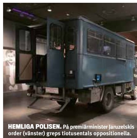
HEMLIGA POLISEN. På premiärminister Jaruzelskis order (vänster) greps tiotusentals oppositionella.