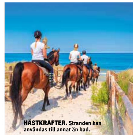
HÄSTKRAFTER. Stranden kan användas till annat än bad.