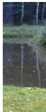
DJURENS RIKE. Nedanför huset går ett vatten-svin, kapybara, världens största gnagare.