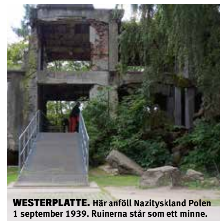
WESTERPLATTE. Här anföll Nazityskland Polen 1 september 1939. Ruinerna står som ett minne.