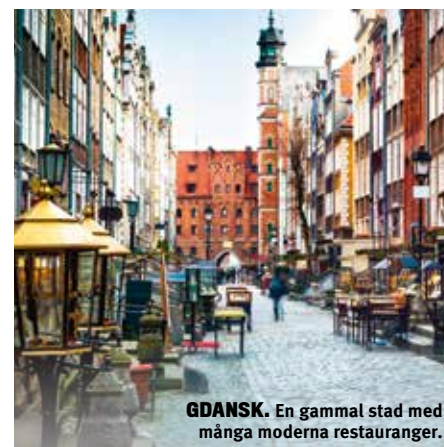
GDANSK. En gammal stad med många moderna restauranger.