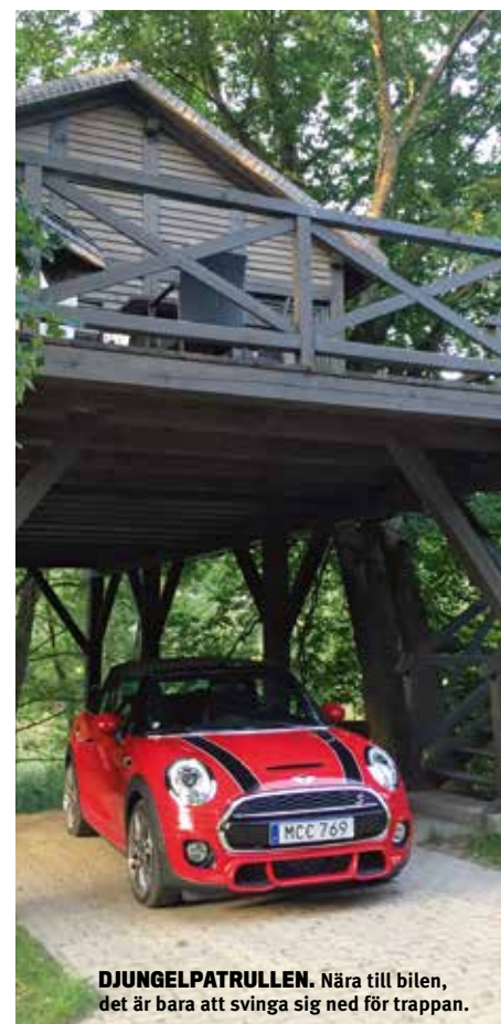
DJUNGELPATRULLEN. Nära till bilen, det är bara att svinga sig ned för trappan.