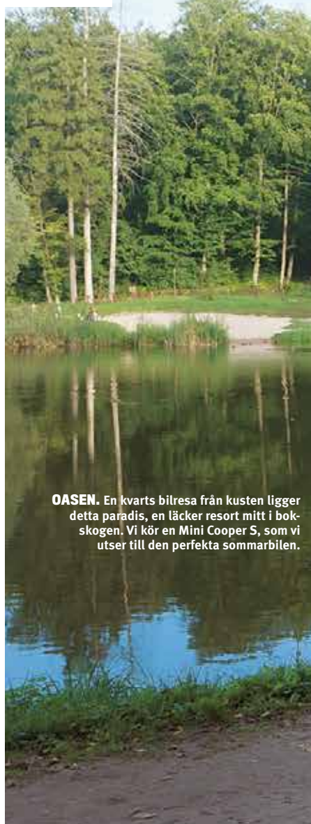
OASEN. En kvarts bilresa från kusten ligger detta paradis, en läcker resort mitt i bokskogen. Vi kör en Mini Cooper S, som vi utser till den perfekta sommarbilen.