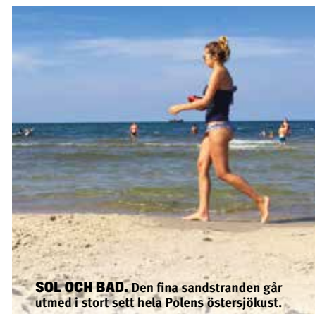
SOL OCH BAD. Den fina sandstranden går utmed i stort sett hela Polens östersjökust.