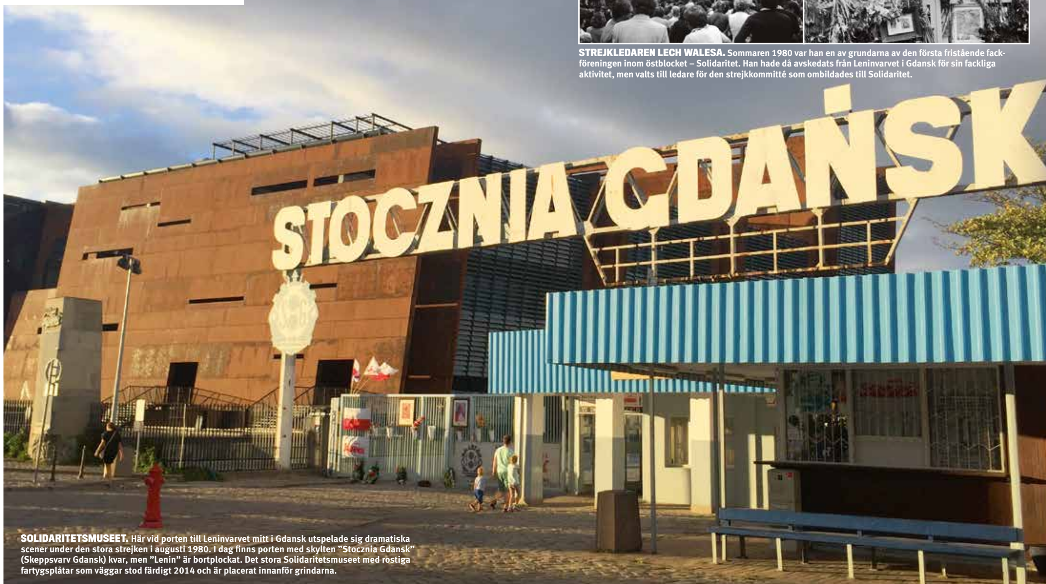
SOLIDARITETSMUSEET. Här vid porten till Leninvarvet mitt i Gdansk utspelade sig dramatiska scener under den stora strejken i augusti 1980. I dag finns porten med skylten "Stocznia Gdanska" (Skeppsvarv Gdansk) kvar, men "Lenin" är bortplockat. Det stora Solidaritetsmuseet med rostiga fartygsplåtar som väggar stod färdigt 2014 och är placerat innanför grindarna.